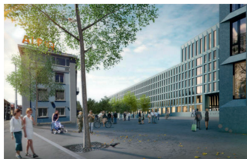
Geplanter Bezug PJZ 2020.