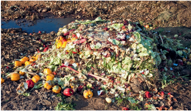
Ein guter Teil des Foodwaste im Lebensmittelhandel ist vermeidbar durch eine verbesserte Planung.